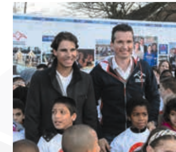
2012 100 Krajicek Playgrounds

In november 2012 openden we de 100ste Playground van Nederland. Playground Donkersingel in Rotterdam wordt feestelijk geopend door Rafael Nadal, Burgemeester Aboutaleb en wethouder Arian Pleizier.