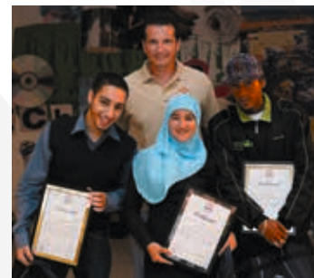
2006 Start Scholarshipprogramma

Buurtsportcoaches verzorgen de basisbegeleiding op onze Playgrounds en hebben dagelijks contact met de kinderen uit de wijk. Met de eerste landelijke bijeenkomst brachten we sportleiders uit het hele land samen om kennis en ervaring uit te wisselen om zo onze programmering nog beter te maken.