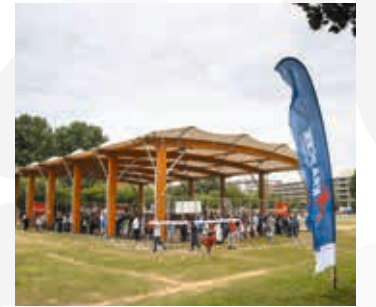
2018 Twee overkapte Krajicek Playgrounds

Dankzij de VriendenLoterij openden we in Den Haag de eerste Playground van de Toekomst. Met 'into the wild' brengen we een stukje natuur midden in de stad. Naast sportelementen zijn er zit-elementen, klimmogelijkheden en is er heel veel groen.