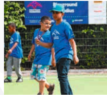
1998 Opening eerste Krajicek Playground

Een jaar na oprichting wordt de eerste Krajicek Playground geopend. Dankzij de steun van de gemeente Den Haag, Nike en de VriendenLoterij wordt in het Haagse Regentessekwartier aan de Hondiusstraat de allereerste Playground geopend.